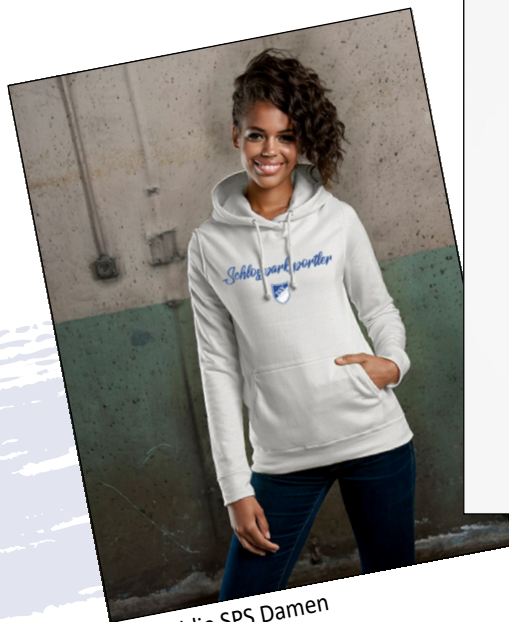
Hoodie SPS Damen