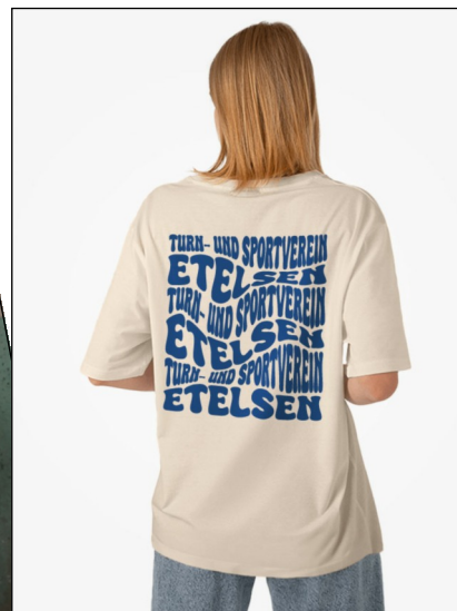
Oversized Shirt Wavy Damen